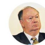
Alberto João Jardim