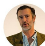
João Cotrim de Figueiredo