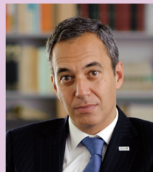
Frederico Costa Presidente do Turismo de Portugal